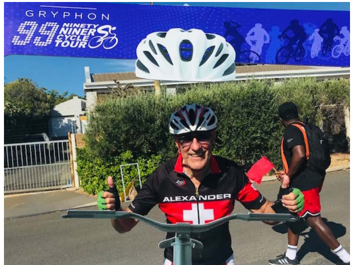
Zufrieden nach der Zieldurchfahrt